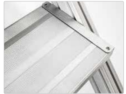
Stufenbelag Aluminium, gerieft