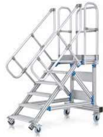
einseitig begehbare Plattformtreppe

Mobile Zugangs- oder Arbeitsplattform mit bequemem Aufstieg. Ideal geeignet für länger andauernde Arbeiten, auch mit Werkzeug und häufigem Wechsel des Arbeitsplatzes. Großflächige Plattform mit Geländer für sicheres und ergonomisches Arbeiten in der Höhe.